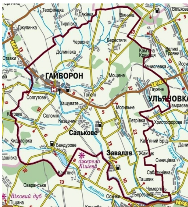
Рис. 2. Гайворонський район Кіровоградської області

Гайворонський район розміщений на заході Кіровоградської області у межах історико-географічної області Поділля, межує із Бершадським районом Вінницької області, Балтським та Савранським районами Одеської області, з Уманським районом Черкаської області та Благовіщенським районом Кіровоградської області (рис. 2).