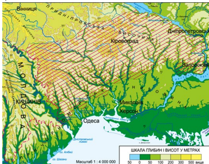
Рис. 1. Міжзональний геоекотон «лісостеп-степ» Правобережної України

Міжзональний геоекотон «лісостеп-степ» Правобережної України людина освоювала впродовж тривалого історичного періоду. Його географічне розташування (на межі кочового степу та прадавньої осілости) значною мірою визначало розвиток історичних подій, котрі віддзеркалювалися на долі народів, що заселяли цю територію (рис.1).