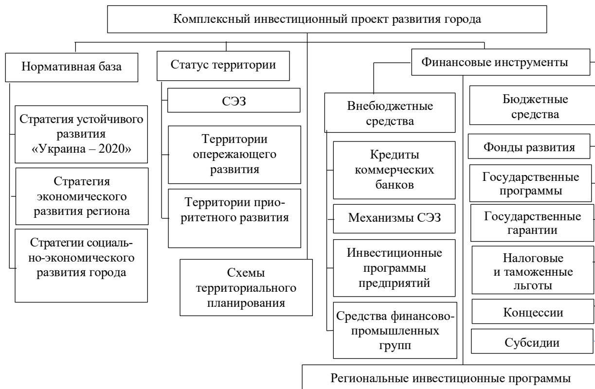
Рисунок 3 – Структура комплексного инвестиционного проекта развития города

В этом случае объединения различных инструментов в единый комплексный проект под единую стратегическую цель с использованием различных механизмов улучшения инвестиционного климата необходимы для привлечения внебюджетных источников. Комплексный инвестиционный проект развития города составляет совокупность инвестиционных проектов, которые объединяют развитие территорий, бизнеса и транспорта, направленных на достижение стратегических задач развития города (рис. 3).