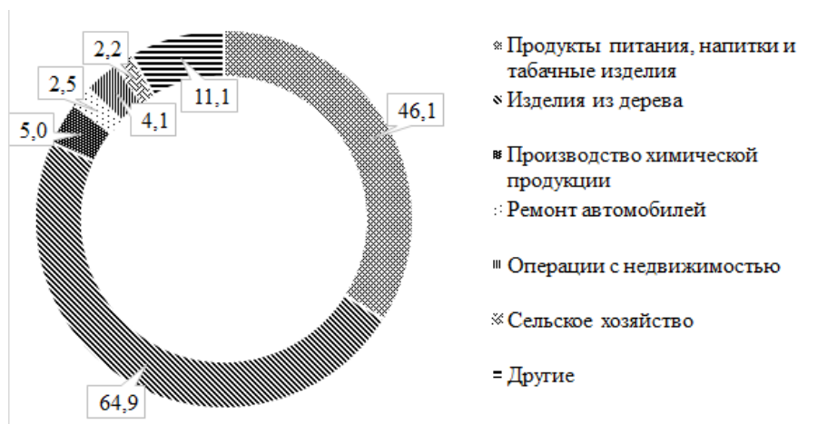
Рисунок 2 – Структура прямых инвестиций по отраслям в экономике города Винницы по 2018, млн долл. США

На предприятиях промышленности (рис. 2) сосредоточено почти 123,1 млн долл. США (90,6%) общего объема прямых инвестиций в экономику города, в т. ч. перерабатывающей – 121,5 млн долл. США (89,4%).