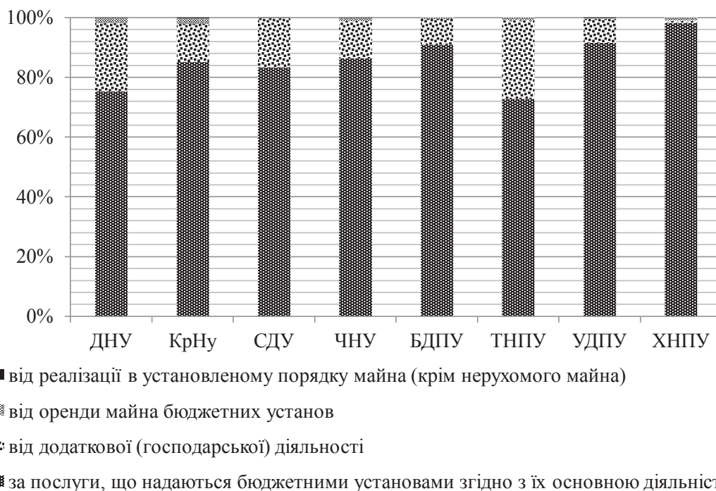
Рис. 3. Структура коштів, отриманих закладами вищої освіти як плата за послуги за КПКВК 2201160 у 2017 р.,%