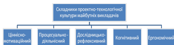
Рис. 1. Структура проектно-технологічної культури майбутніх викладачів

Таким чином, у ході дослідження виділено такі складники проектно-технологічної культури майбутнього викладача закладу професійно-технічної освіти: ціннісно-мотиваційний, когнітивний, процесуально-діяльнісний, дослідницько-рефлексивний та ергономічний, кожний із них має складну структуру, яка включає ціннісний, когнітивний, діяльнісний та креативний компоненти (рис. 1).