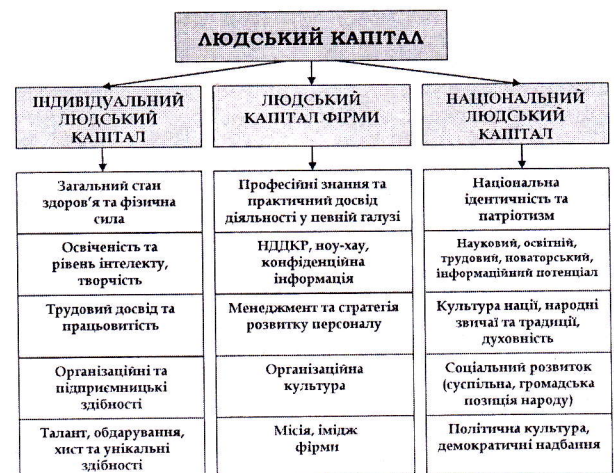
Рис. 1. Класифікація людського капіталу за рівнями використання та структура його видів

Ми пропонуємо наступну структуру людського капіталу, що включає його класифікацію і поділ на види (рисунок 1), яка, в теоретичному плані, допоможе більш повно розкрити сутність даного поняття, а в практичному – забезпечить можливості державного регулювання його розвитку.