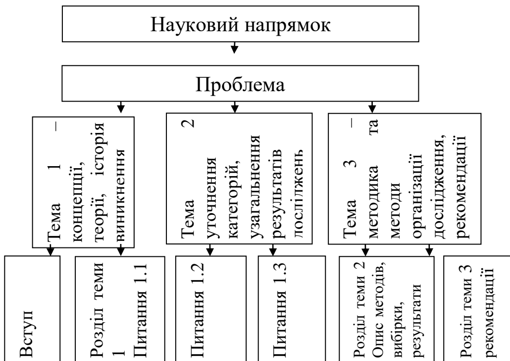
Схема № 3. Структурна схема рівнів наукового дослідження.

Проблема дослідження характеризує проблемну ситуацію, яка відображає протиріччя між типовим станом об'єкта дослідження в реальній практиці з вимогами суспільства, до його більш ефективного функціонування.