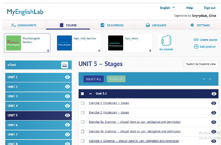
Рис. 4. Сторінка курсу New Total English з переліком модулів, тем та вправ до них на платформі MyEnglishLab.

Така сучасна платформа розроблена для вивчення англійської мови, мета якої мотивувати студентів вивчати англійську а також забезпечення можливості для вивчення і удосконалення мови будь-де, будь-коли, лише з використанням телефону чи планшета. Більше того, студенти можуть виконувати завдання будь-де за умов наявності доступу до мережі Інтернет (вдома, в комп'ютерному класі, інтернет-кафе, на відпочинку тощо) [13].