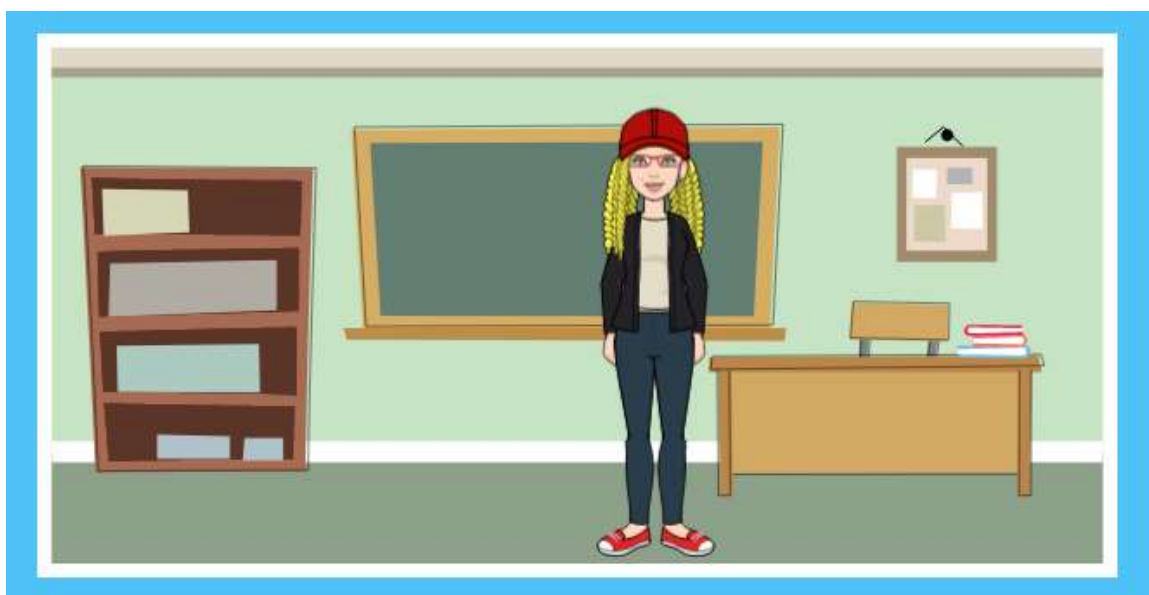
Рис.3. Зображення учня в школі

викликатиме позитивні емоції, доступність навчального матеріалу, асоціативність з уже відомими фактами або об'єктами, мотивацію до навчання