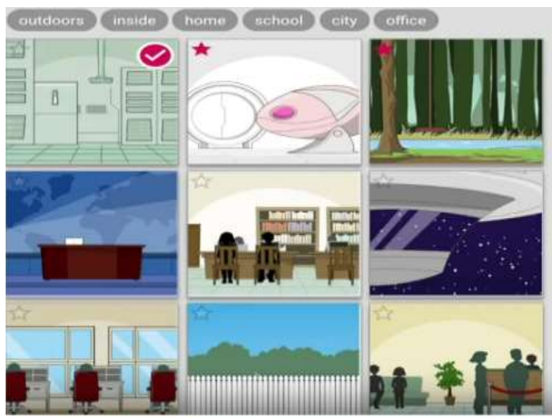
Рис.4. Робота у сервісі Pixton.com

Дидактичний потенціал цифрових коміксів відображається не лише у тому, щоб вчитель проявив себе, розробляючи візуальне представлення теоретичного матеріалу, але й для більш глибокого засвоєння учнями навчального матеріалу надає можливість створення коміксів самими учнями. Технологія виконання завдання може бути описана наступним чином: