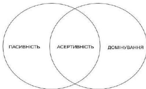
Рис. 1. Моделі поведінки

комунікації – коли людина вільно говорить пропочуття, може не згоджуватися з позицією іншого, не нападаючи на нього. Тримає свої межі і не переходить за межі іншого. Співрозмовник в такій моделі – рівний партнер. В такій комунікації остаточні рішення враховують інтереси обох сторін [2].