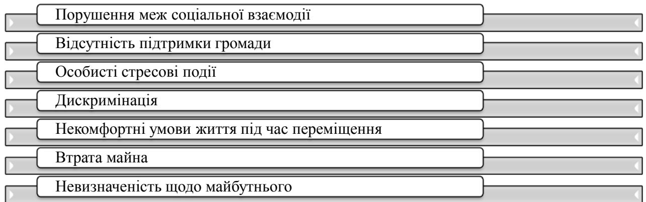
Рис. 3. Найпоширеніші стресові фактори, що негативно впливають на осіб, які постраждали від війни

Для людей, які потрапили в складні життєві обставини, пережили кризову ситуацію, важливе значення має не лише входження в нове соціальне середовище, а й відновлення психологічного стану, зумовленого стресовими факторами (рис. 3).