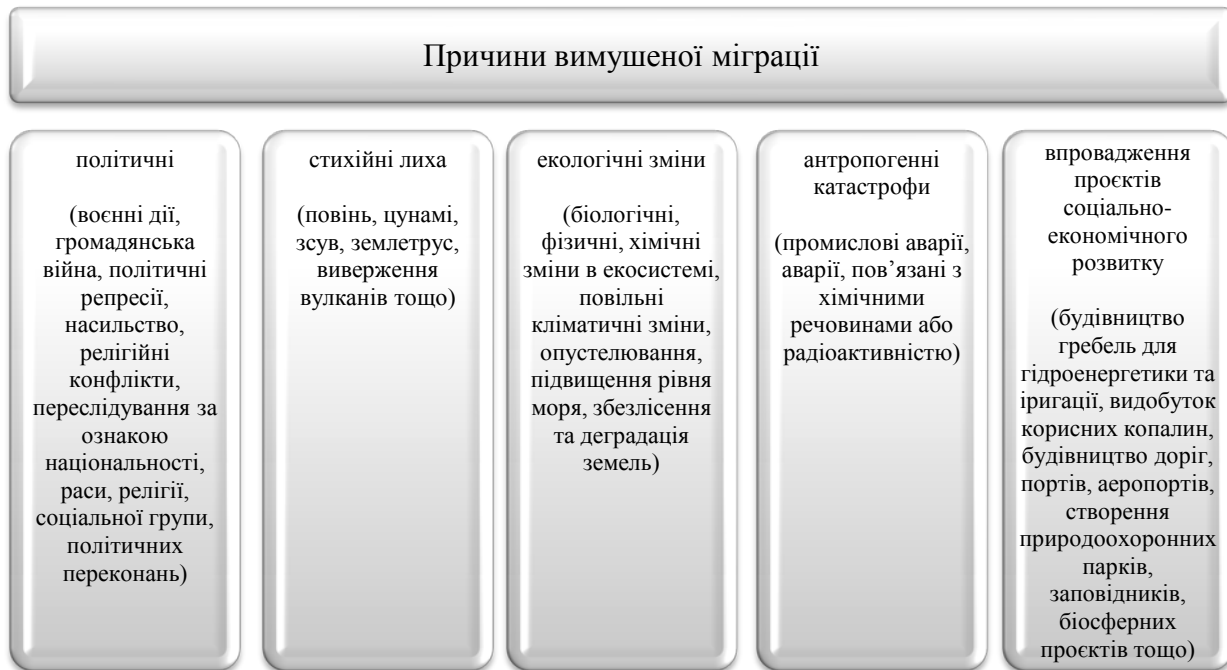
Рис. 1. Причини вимушеної міграції *