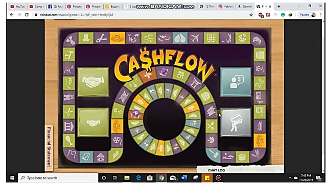
Рис. 2. Вікно гри “CashFlow”

умовах: зі стабільною зарплатою і нормальними витратами на проживання. Кожен гравець отримує змодельовану ситуацію, легенду гравця. Під час гри ситуація змінюється: хтось потрапляє в боргову яму, а хтось поступово будує бізнес для досягнення своєї дорогоцінної мрії.