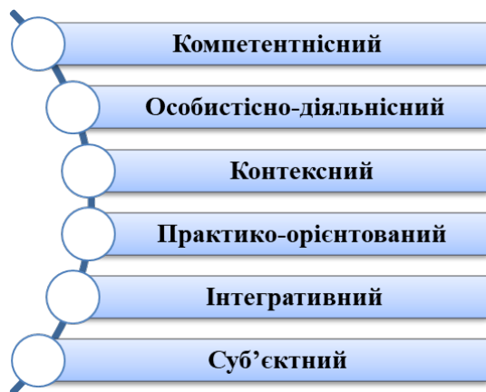
Рис. 1. Підходи щодо формування фінансової грамотності молодших школярів

Ефективність досягнення цієї мети можлива лише завдяки використанню в освітньому процесі різних педагогічних умов, які в свою чергу реалізуються на засадах компетентнісного, особистісно-діяльнісного, практико-орієнтованого та інтегративного підходів навчання (рис. 1).