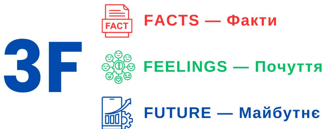
Рис. 2. Модель 3F Мартіна Фарела

Модель 3F Мартіна Фарела надає можливість проаналізувати власні почуття, поглянути на ситуацію об'єктивно та спрогнозувати майбутнє відповідно до фактів і почуттів. Цей формат підходить для аналізу ситуації або підготовки до прийняття рішення