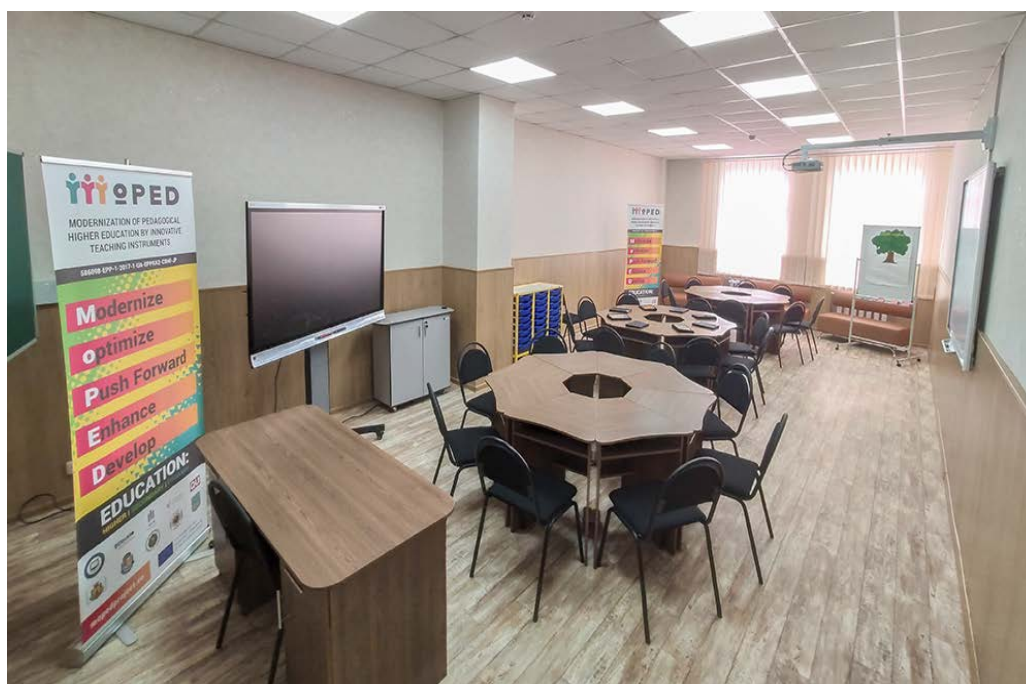
Рис. 3. Центр новітніх освітніх технологій «USPU Ecosystem»

В Уманському державному педагогічному університеті імені Павла Тичини на факультеті фізики, математики та інформатики, в межах проекту «Модернізація педагогічної вищої освіти з використання інноваційних інструментів викладання» (MoPED) програми ЄС Еразмус + КА2 –Розвиток потенціалу вищої освіти, № 586098-EPP-1-2017-1-UA-EPPKA2-SVNE-JP створено Центр новітніх освітніх технологій «USPU Ecosystem». Інноваційний клас містить чотири зони: навчальну зону (Training zone), зону досліджень (Research zone), творчу зону (Creative zone), зону особистого простору студента (Zone of student's personal space) (рис.3).