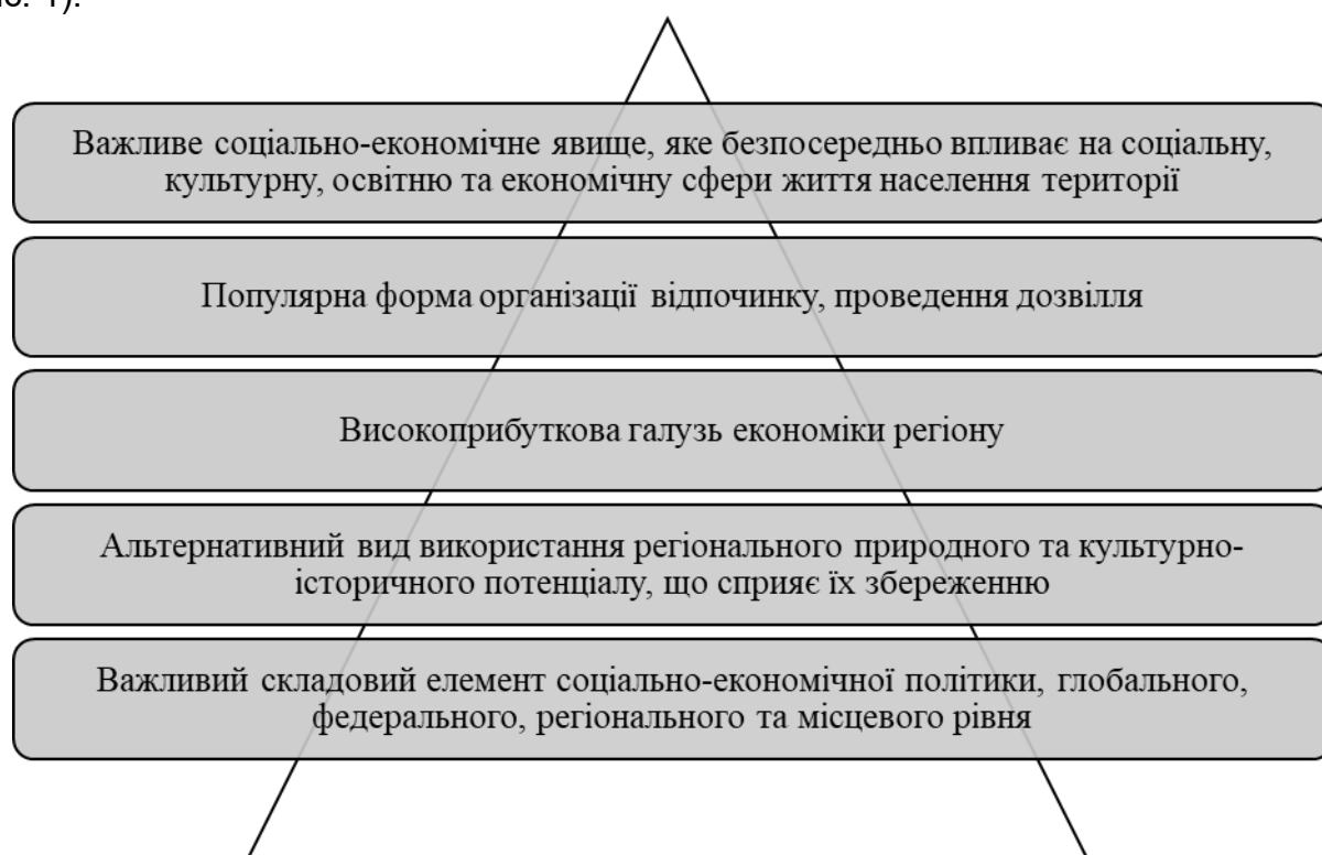
Рис. 1. Схема аналізу наукових джерел дослідження туристсько-рекреаційного потенціалу регіону в контексті вивчення туризму та рекреації.

Проведений нами аналіз різних наукових джерел, дає підстави стверджувати, що туризм та рекреація для дослідження туристсько-рекреаційного потенціалу регіону, це (рис. 1):