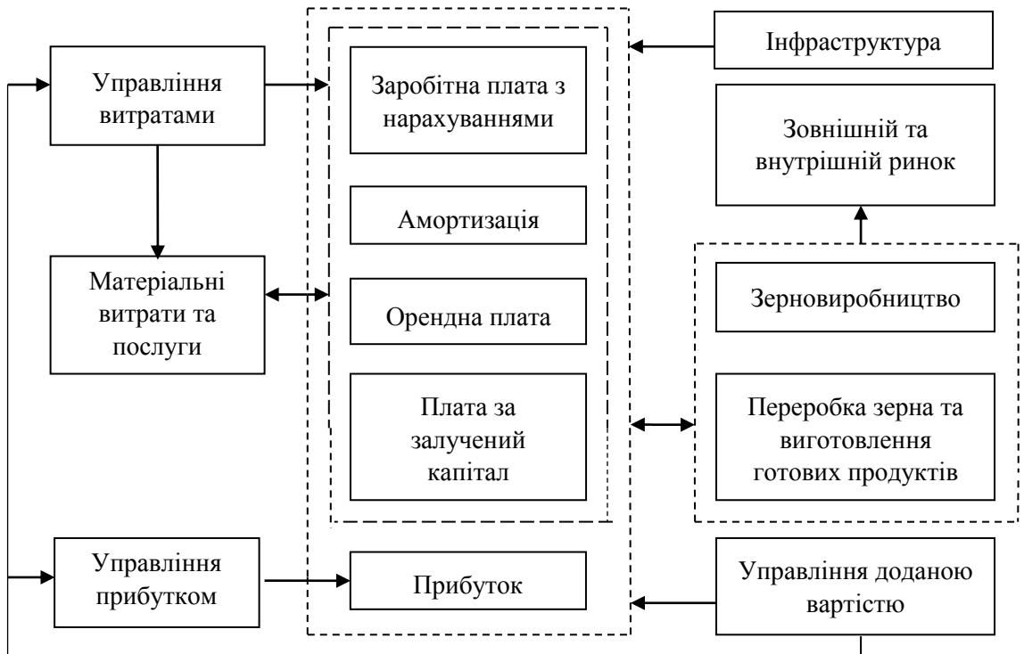
Рис. 2. Загальна схема управління доданою вартістю у виробництві та переробці зерна

оптимального формування таких статей витрат, як заробітна плата та амортизація необхідно постійно удосконалювати управлінські процеси.