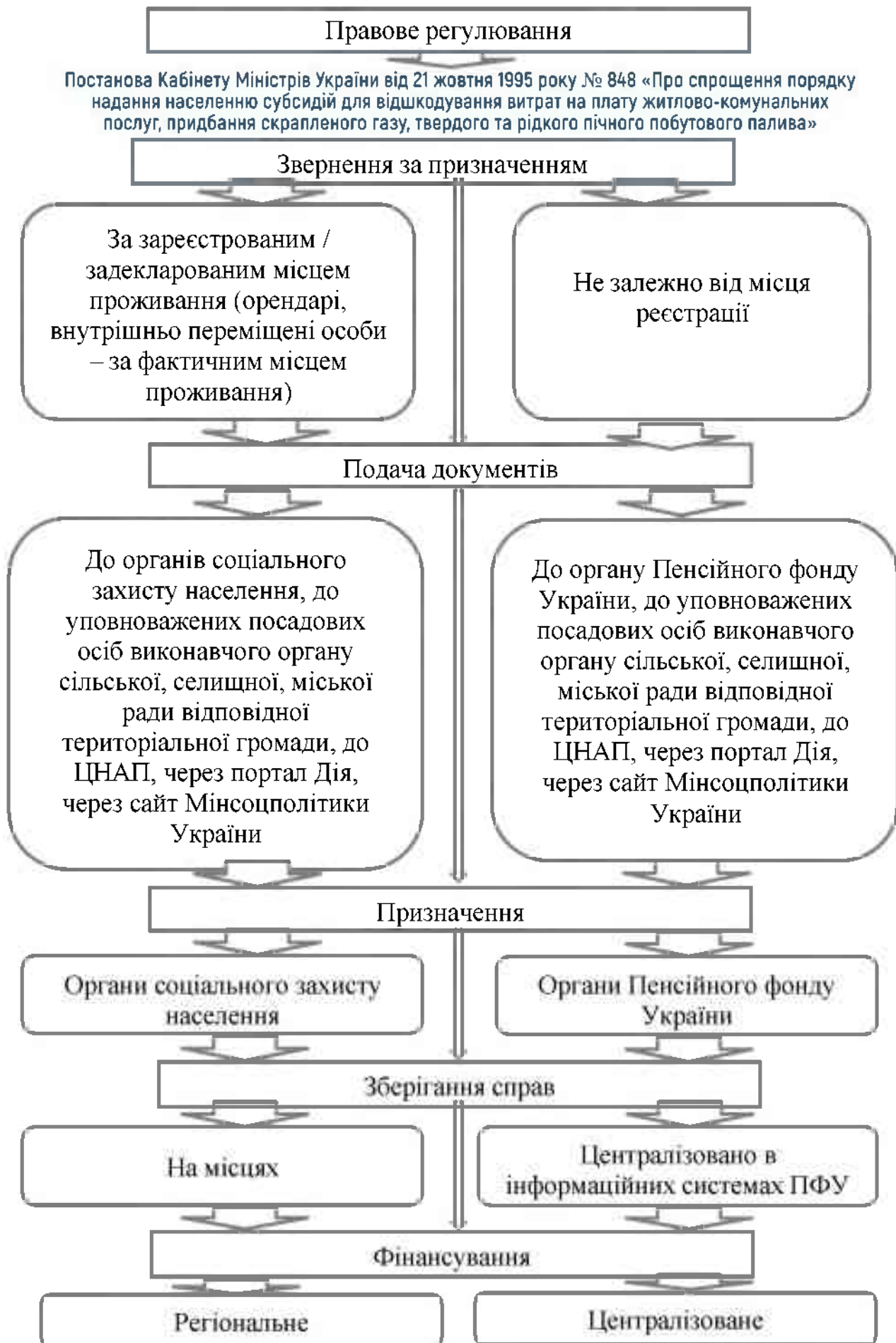
Рис. 1. Алгоритм нарахування субсидії