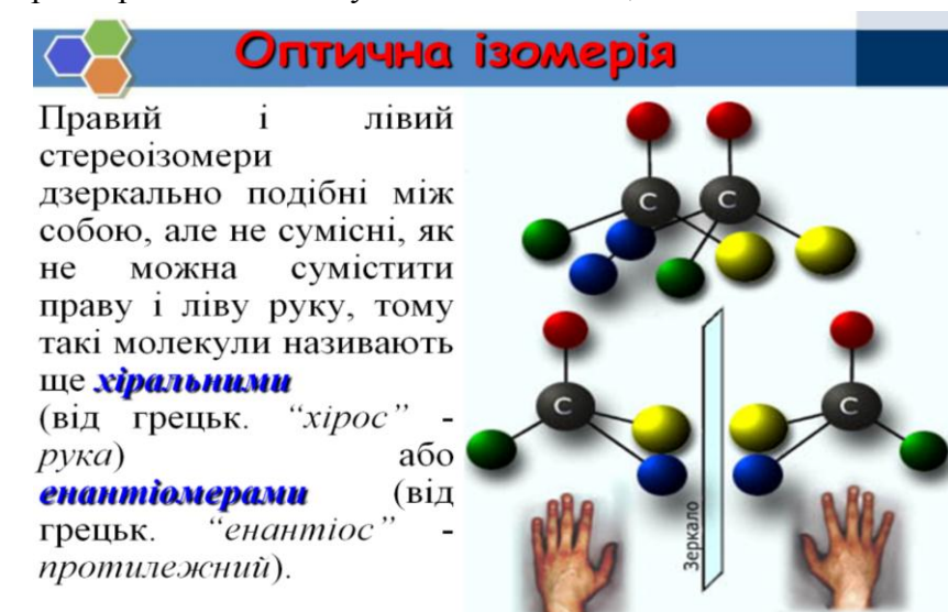
Рис. 2. Слайд із використанням кольору.