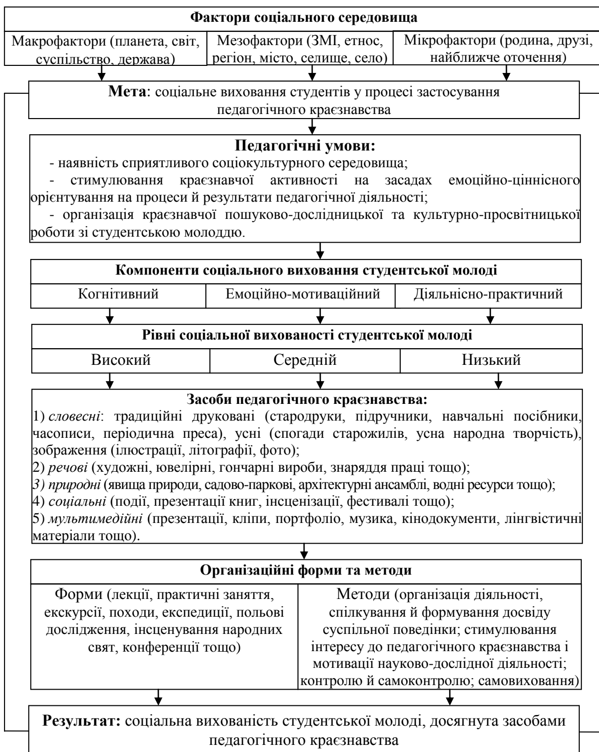
Рис.1. Модель організаційно-методичного забезпечення соціального виховання студентської молоді засобами педагогічного краєзнавства