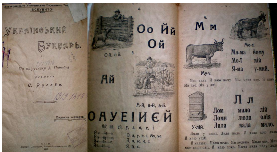
С. Русова «Український буквар» (1919)