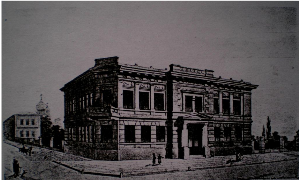
Будинок Харківської приватної жіночої недільної школи Х.Д. Алчевської

наставницею, вчителькою і керівником великої групи педагогів, які самовіддано навчали грамоти простих людей» 32 .