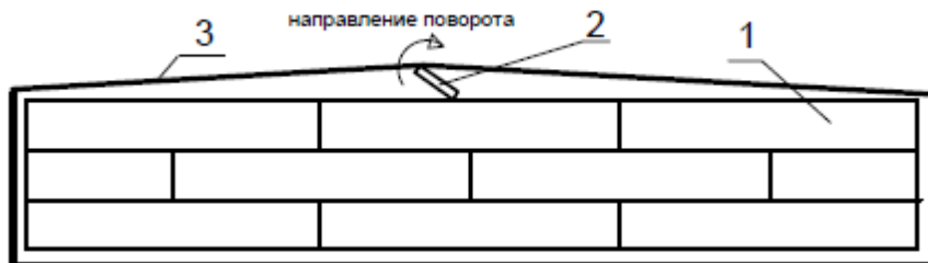
Рис. 3. Схема включения замкнутой обоймы с помощью поворота плоского рычага. 1 – легковесные блоки; 2 – плоский рычаг; 3 – обойма

стали толщиной 20 мм, к которому приварена рукоятка с рычагом для поворота.