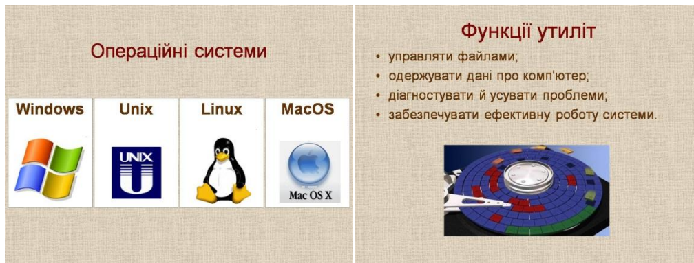
Рис.2. Зразки навчального матеріалу презентації

Окрему увагу доцільно звернути на пояснення матеріалу під час проведення вебінару, щоб показ слайдів не супроводжувався нудним читанням, а створювалась атмосфера реального спілкування. Тому потрібно передбачити в своїх поясненнях запитання до аудиторії. Це не тільки активізує студентів, але й дасть змогу зрозуміти хто розуміє і слухає лектора. Крім того, потрібно час від часу переглядати сторінку текстового чату, де можуть бути запитання від студентів.