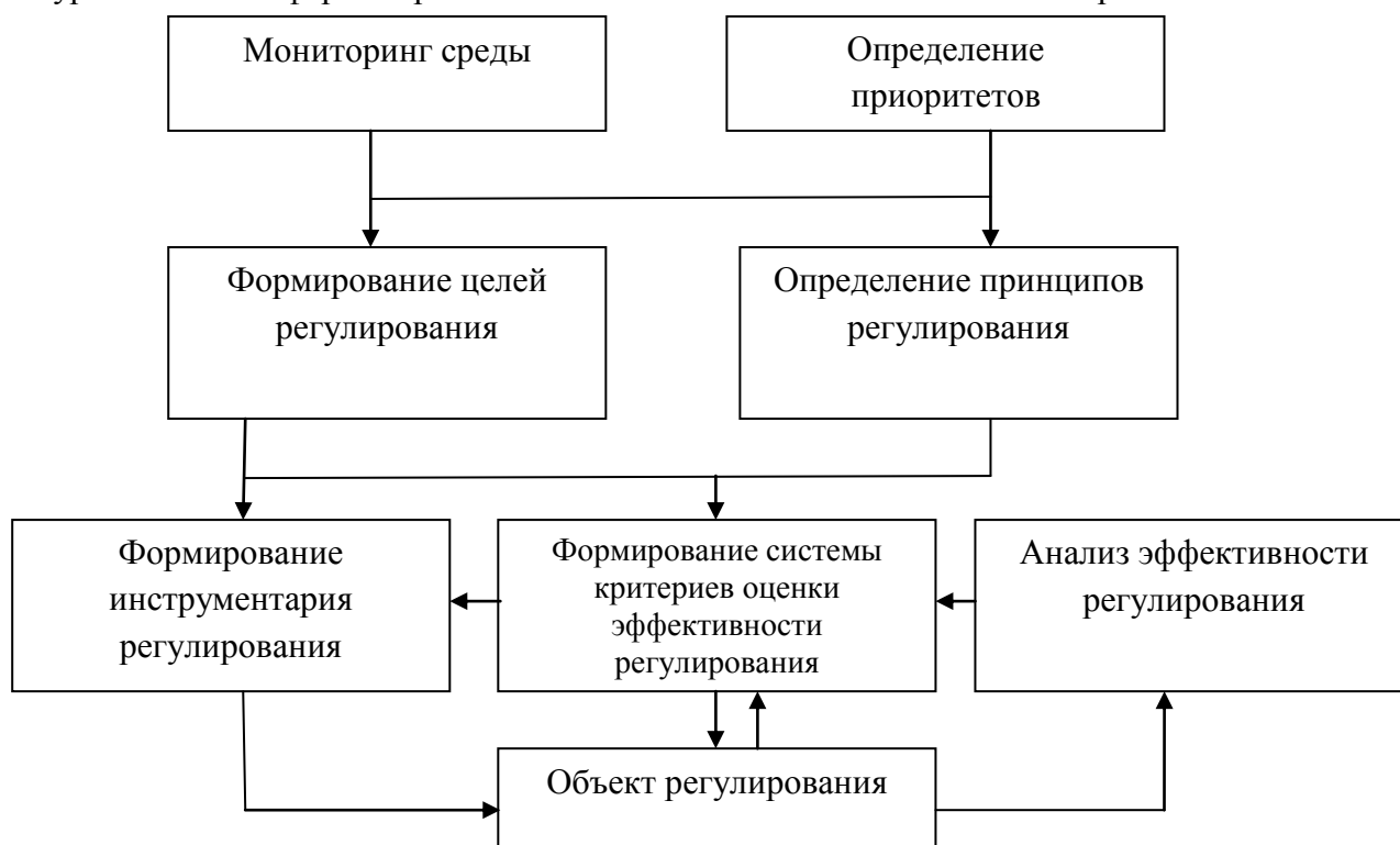
Рис. 2. Логическая схема организационно-экономического механизма регулирования туристической сферы Украины

Учитывая вышеизложенное, необходимо обосновать научные подходы к формированию организационно-экономического механизма регулирования туристической сферы Украины. Основные его элементы изложены на рис. 2.