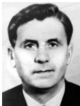
Андрій Данилович Скаба́ (1905–1986 рр.) — український радянський партійний і державний діяч, історик. Дійсний член АН УРСР (обрано 20. XII. 1967 р.)

При цьому важливо розкрити ідейно-політичну спорідненість і наступність доктрин сучасних трубадурів націонал-комунізму з поглядами їх посередників, зокрема, боротьбистів та різних націонал-ухильницьких елементів в КП(б)У, їх теоретичну неспроможність і політичну шкідливість».