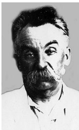
Мазлах Сергій Михайлович (Робсман Сергій Михайлович) (1878–1937 рр.) — діяч КП(б)У, один із фундаторів українського націонал-комунізму

Сергій Михайлович Робсман (прізвище Мазлах було взяте з метою конспірації після повернення з еміграції у 1907 р.) народився у 1878 р. у єврейській родині крамаря у селі Іванівка Слов'яносербського повіту Катеринославської губернії (на території нинішнього Антрацитівського району Луганської області). Закінчив 2-класне народне училище. З 16 років працював розвозчиком хліба на руднику, підробляв уроками.