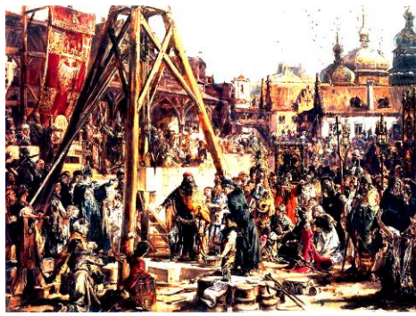
Повторне взяття поляками Русі у 1366 р.

Битва на Сініх Водах (Синьоводська битва; вірогідно між 24 вересня – 25 грудня 1362 р. – битва, що відбулася на річці Сині Води (Синюха) між литовсько-руським військом Великого князя Литовського Ольгерда Гедиміновича та ордами монголо-татарських правителів на Поділлі, поблизу фортеці Торговиці (тепер село Новоархангельського району Кіровоградської області).