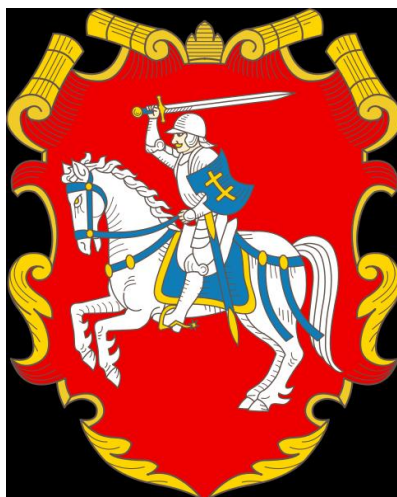
Герб Великого князівства Литовського

Проте це не спиноло амбіцій обох супротивників. Оскільки свого часу поляки не дотрималися умов миру 1344 р., литовці не відчували себе скутими умовами нового договору 1350 р. Бажаючи повернути собі Галичину, Литва того ж року напала на її територію.