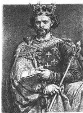
Людовик I Великий

У 1366 р. поляки вкотре порушили підписані ними угоди і здійснили добре підготовлену кампанію по завоюванню Волині. Вони здобули Холм, Белз, Володимир і Луцьк, змусивши підписати литовців новий договір.