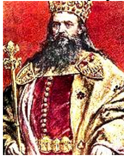
Казимир III Великий

Русько-литовські князі Олександр Коріятович і Юрій Наримунтович, які були ленниками польської корони, перейшли на бік Литви. Завдяки цьому нападові Велике князівство Литовське повернуло собі втрачені землі.