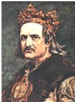
Владислав II Ягайло

Територіальні зміни що закріплювали поділ галицько-волинських земель на польську Галичину і литовську Волинь були затверджені Островською угодою 1392 р., підписану Ягайлом і Вітовтом.