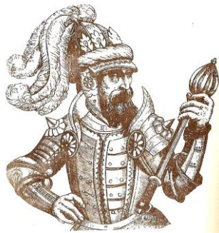
Великий князь Литовський Ольгерд

Перший етап — це протистояння поділеної на три відділи орди та розташованих півколом і поділених на шість загонів військ Ольгерда. Спроба ординців знищити загони у центрі виявилася невдалою.