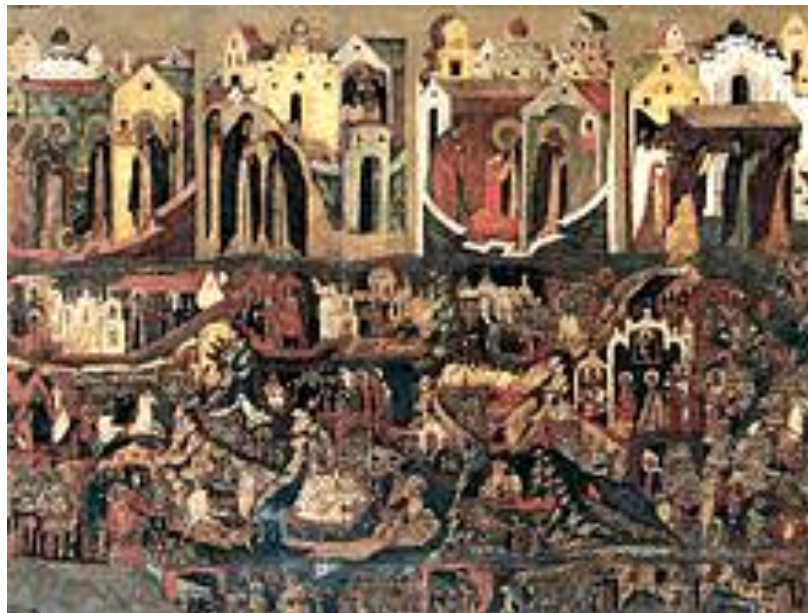
Руські міста делегують воїнів в Москву на битву з Мамаєм. Деталь ярославської ікони «Сергий Радонежский с житием»

Дані щодо чисельності військ, які брали участь в битві, сильно розходяться.