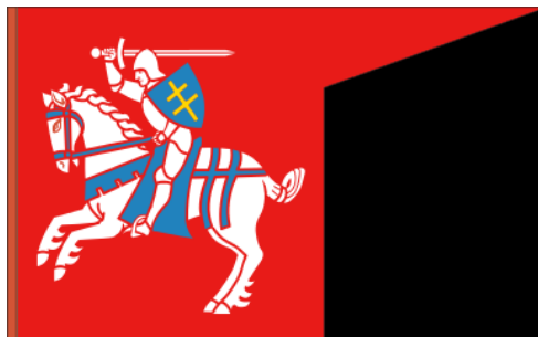
Прапор Великого князівства Литовського

Важливим етапом в становленні Великого князівства Литовського були постійні збройні конфлікти XIV століття з претендентами на словянські землі. Важливе місце в цьому процесі належить війні за галицько-волинську спадщину (1340 – 1392 рр.) – довготривалому збройному конфлікту між Великим князівством Литовським і Королівством Польським за територію Королівства Русі, яке втратило у 1340 р. свого останнього монарха, короля з династії П'ястів, Юрія II Болеслава.