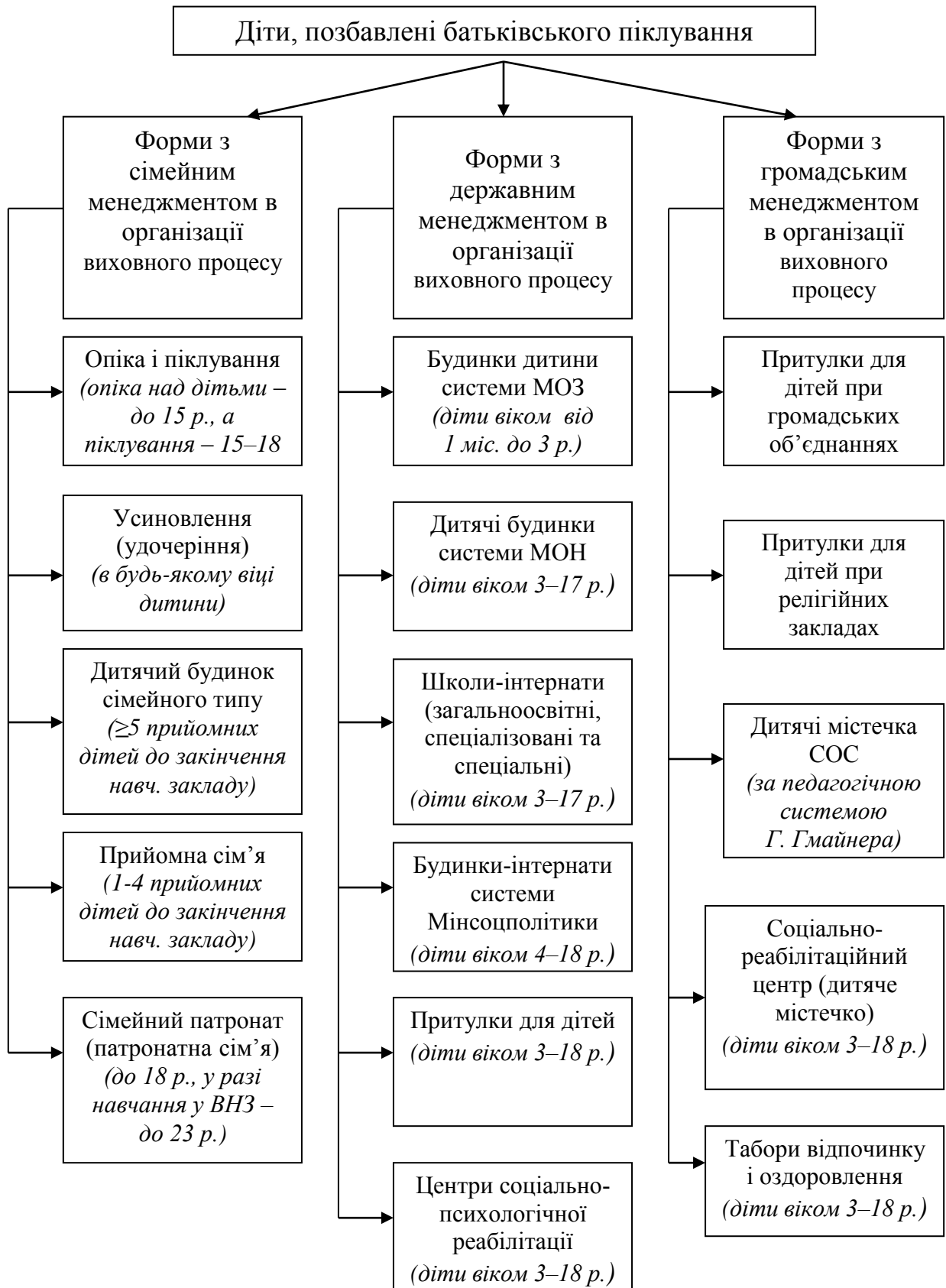
Рис. 2. Організаційна структура форм улаштування дітей, позбавлених батьківського піклування, в Україні