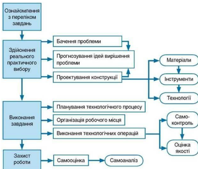
Рис. 9. Етапи виконання творчих проектів

Етапи під час виконання творчих проектів можна простежити за схемою, зображеною на рис. 9.