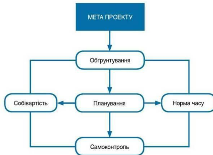
Рис. 5. Зв'язок між метою і собівартістю та строками реалізації проекту Наведемо класифікацію проектів, які ви можете виконувати самостійно або під керівництвом учителя.

основними параметрами проекту показано на рис. 5.