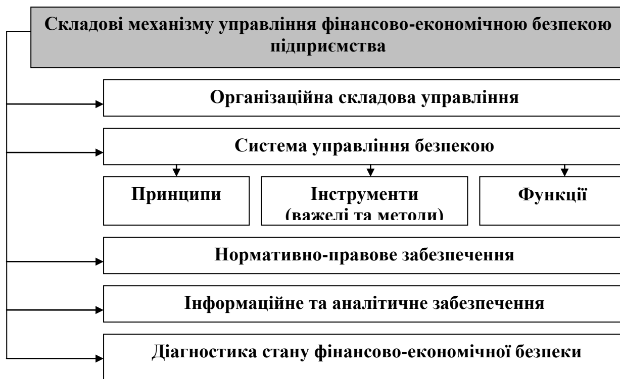
Рис.1. Сукупність складових механізму управління фінансово-економічною безпекою підприємства

відносин. Вона визначається також цілями розвитку підприємства, зовнішніми умовами його існування.