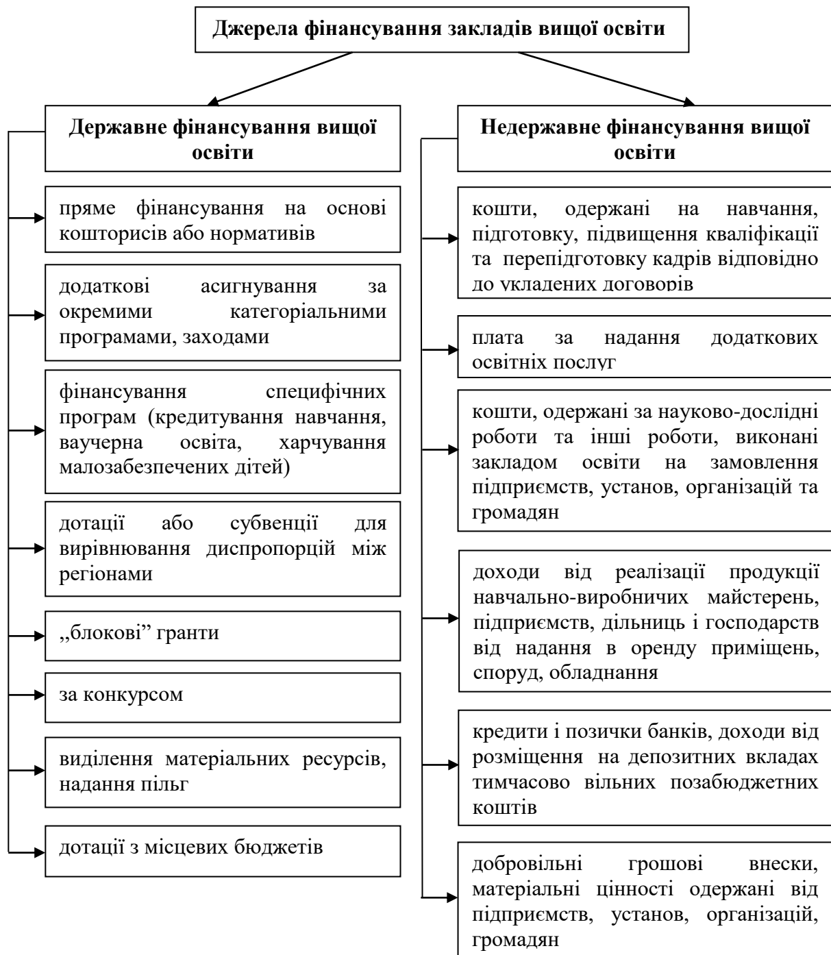
Рис.1. Джерела фінансування закладів вищої освіти

вищих навчальних закладів ґрунтується на застосуванні нормативного методу формування та використання фінансових ресурсів.