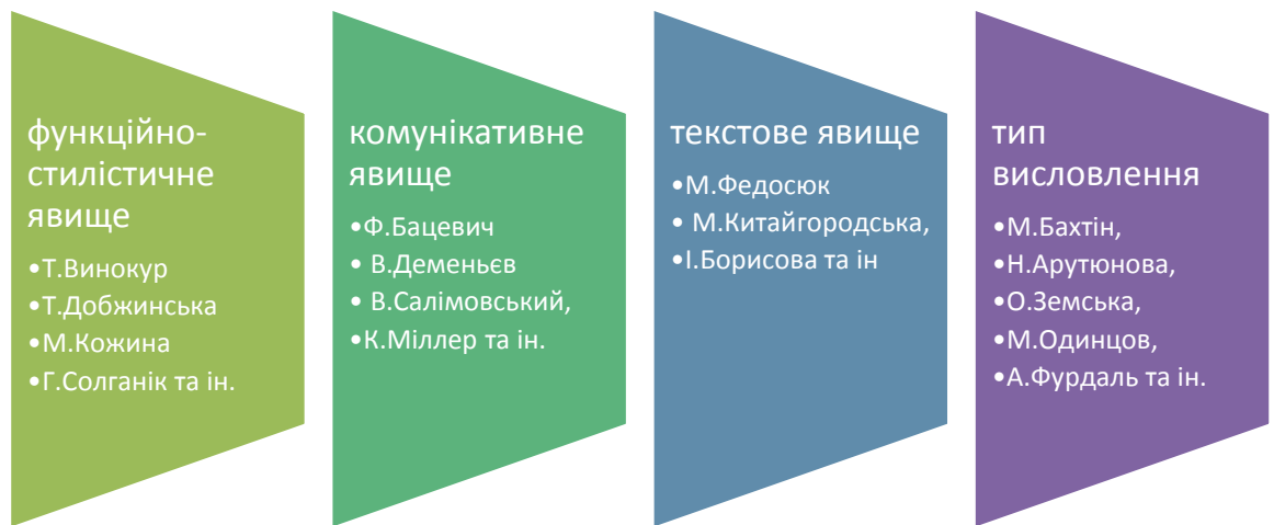
Схема 2. Мовленнєвий жанр як наукове поняття

Засновник сучасної теорії мовленнєвих жанрів М. Бахтін стверджував, що людське мовлення в типових ситуаціях втілюється в певні готові форми мовленнєвих жанрів, які «дані нам, як рідна мова» і є певною мірою «безособистісні» [2]. Мовленнєві жанри організовують наше мовлення і спілкування між людьми практично так, як його організовують граматичні форми. Вони мають певні характерні ознаки (комунікативну мету, концепцію адресата й адресанта, обсяг тощо).