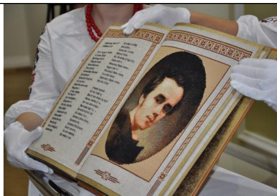
Фото № 5.

Збережено абсолютно всі авторські знаки. Для вишивання тексту був розроблений спеціальний шрифт, ідентичний шрифту «Кобзаря» середини XIX століття. Вісім поетичних творів без скорочень вишили методом стебнівка, який дозволяє вільно читати поезії. На кожній сторінці присутній традиційний український орнамент. Тексти «Кобзаря» редактори доповнили відповідними ілюстраціями, які вишиті хрестиком. Так, відтворено шість малярських творів Тараса Шевченка, які належать до періоду його ранньої творчості. Книга містить 48 сторінок з дикого льону розміром 36,5 x 26 см. Переплетення і шкіряна внутрішня обробка зроблені за зразком оформлення стародруків. Вишитий «Кобзар» важить 3,3 кг, а зберігають його в спеціальній шкіряній сумці-футлярі. Брати книгу в руки можна тільки в білих рукавичках [7].