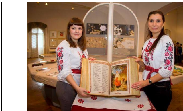
Фото № 4.

(«Нащо мені чорні брови»), «До Основ'яненка», «Іван Підкова», «Тарасова ніч». Варто зауважити, що твори вишиті мовою оригіналу.