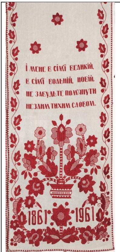
Фото № 3.

Помітним явищем в українській державі й у всьому світі стало відзначення знаменної події – 200-річчя від дня народження Тараса Шевченка. З цієї нагоди указом президента 2014-й оголошено в Україні Роком Шевченка, створено Координаційну раду з питань підготовки та відзначення ювілею великого Кобзаря. Не лише державні заклади, а й численні громадські організації провели цікаві заходи та програми, приурочені до цієї дати.