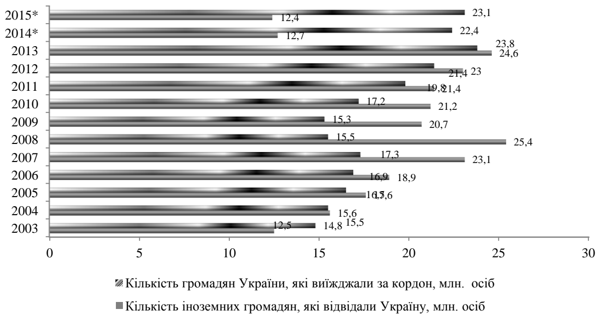
Рис. 2. Динаміка туристичних потоків в Україні у 2003-2015 рр.

* Без урахування тимчасово окупованої території Автономної Республіки Крим, м.Севастополя та частини зони проведення антитерористичної операції.