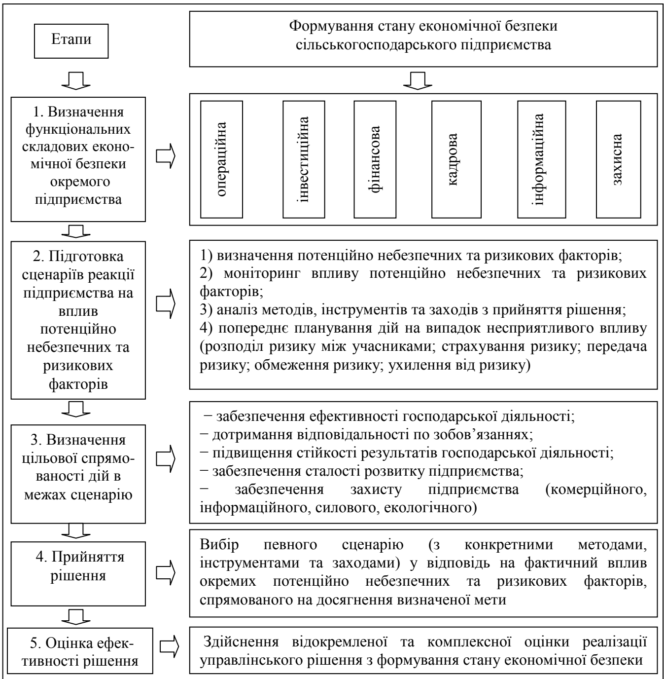
Рис. 1. Алгоритм формування стану економічної безпеки сільськогосподарського підприємства

несприятливого впливу потенційно небезпечних та ризикових факторів, визначення цільової спрямованості дій та безпосередньої реалізації конкретного до певних умов господарського рішення (рис. 1).