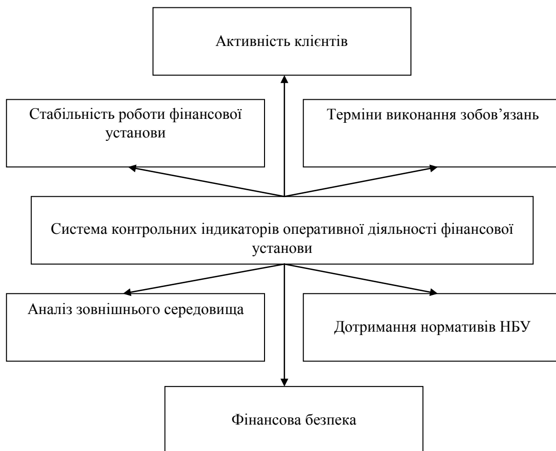
Рисунок 2. Система контрольних індикаторів оперативної діяльності фінансової установи (складено авторами).

Тому рекомендується використовувати систему контрольних індикаторів оперативної діяльності фінансової установи (рис. 2).