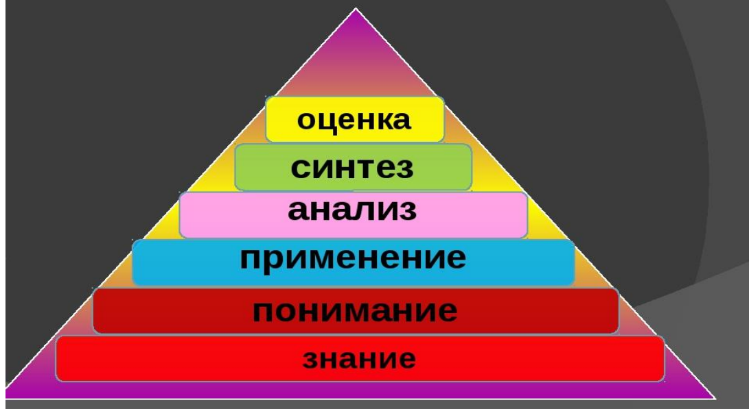
Рисунок – Таксономия Блума