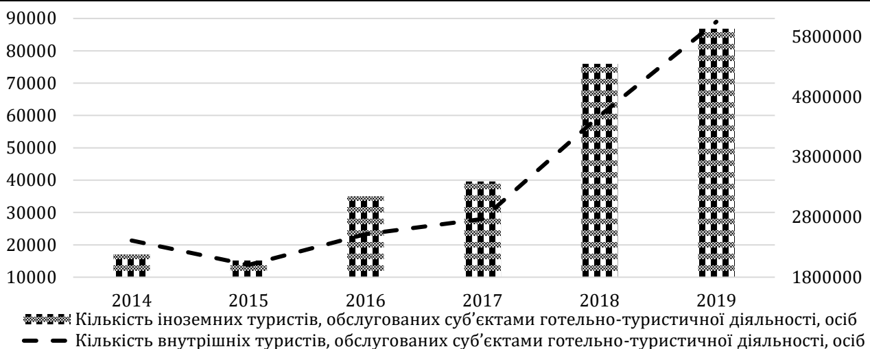
Рис. 3. Кількість туристів обслуговуваних суб'єктами готельно-туристичної індустрії у 2014-2019 рр.

Джерело: побудовано на основі даних [8].