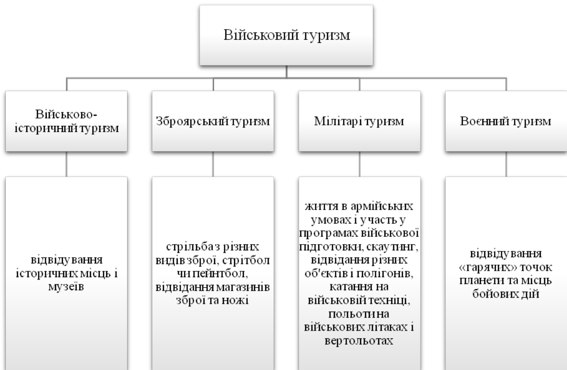
Рис. 1. Підвиди військового туризму за М. П. Кляп та Ф. Ф. Шандор Fig. 1. Subspecies of military tourism according to M. P. Klyar and F. F. Shandor

Інші науковці В. Кушнар'єв та О. Поліщук із військовим туризмом ототожнюють мілітарі-туризм і описують його як частину сегменту спеціалізованого туризму, що містить елементи розважального, пригодницького, екстремального та пізнавально-історичного туризму, та включає в собі продукти, які стосуються військового обладнання та знання історичних подій. Також вони виокремлюють інші підвиди цього виду туризму (рис. 2) [9].