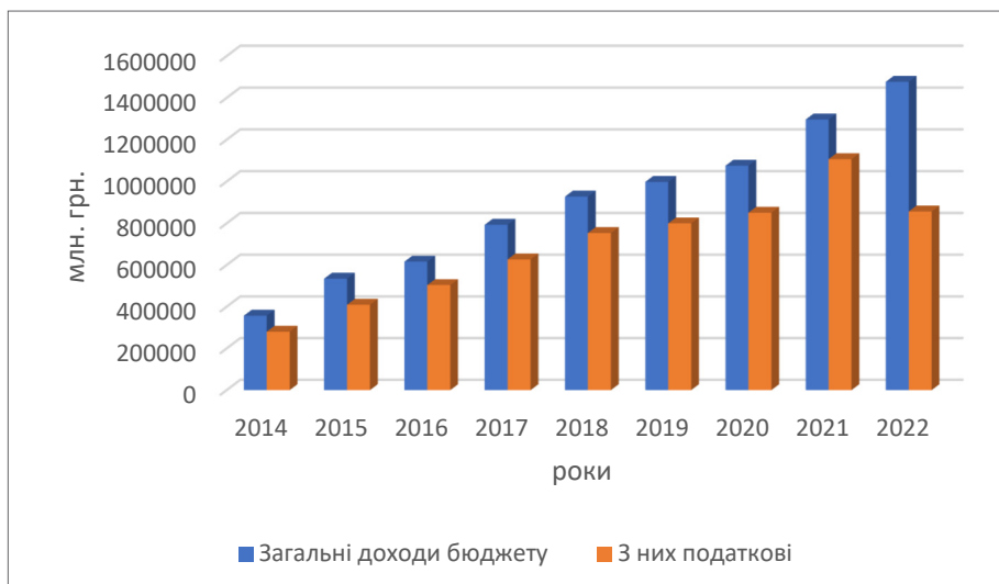
Рис. 1. Динаміка доходів державного бюджету України (млн грн.) та частки (млн грн.) податкових надходжень у доходах бюджету за 2014–2022 рр.

Проведені дослідження показують, що податок на додану вартість дає найбільший відсоток надходжень до державного бюджету. Це пояснюється тим, що його формування відбувається на всіх стадіях виробництва та обігу, обліковується за допомогою націнки на ціну товару та оплачується кінцевим споживачем, але його перерахування та облік до бюджету здійснюється податковим агентом. Іншими показниками, які впливають на високий обсяг сплати ПДВ, є досить ефективний механізм нарахування та сплати, який унеможливує ухилення платників від сплати цього податку. Досить значну частку доходів бюджету посідає акцизний податок, так у структурі 2020 року його частка становила 16,2%. Акцизний податок є одним із нестабільних податків щодо формування дохідної частини бюджету, що зумовлено постійними змінами законодавчої бази оподаткування