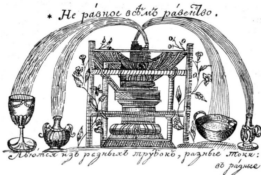
Рис. 1. Фонтан «нерівної всім рівності» Григорія Сковороди

Сутність життя людини — віднайти своє покликання, розкрити власні таланти. Лише тоді людина буде щасливою. Це метафорично відображено у намальованому Г. Сковородою фонтані «нерівної всім рівності», який, зокрема, зображено на 500-гривневій купюрі. Фонтан нерівної рівності намалював сам Г. Сковорода (рис. 1).