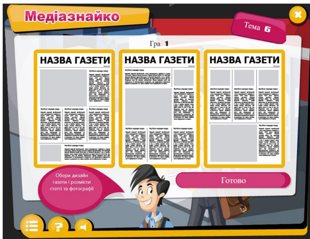
Рис. 1. Створення газети в грі «Медіазнайко»

Медіазнайко – онлайн-сервіс, що дозволяє користувачу розглянути основні теми медійного поля. Перед ним стоїть 9 етапів, у яких потрібно відповідати на питання, а також можна спробувати себе як журналіст, створити сайт, газету (Рис. 1.), чи телепрограму. Зрозуміти як працюють медіа в Україні та їх вплив на споживача інформації.