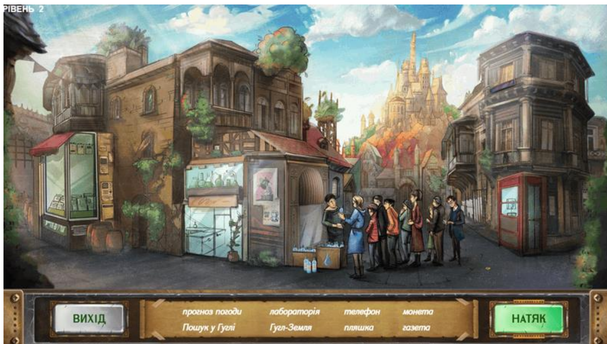
Рис. 2. Інтерфейс гри «Пригоди Літератуса»

Пригоди Літератуса – гра має сюжет, котрий дозволить здобувачам зануритись у світ інформації (Рис. 2). В онлайн-грі головний герой Літератус прагне врятувати свою кохану Верітас, викрадену злим чарівником Маніпулісом. Гра має 10 рівнів, на кожному з яких Літератус стикається з різними завданнями, що вчить користувача критично оцінювати інформацію, яку він отримує з різних джерел [2].