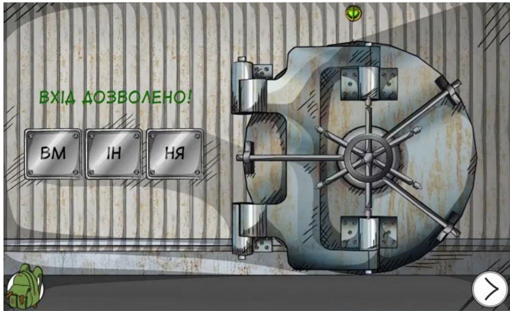
Рис. 3. Проходження гри «Медіаграмотна місія»

й освіту. Тому, щоб бути компетентною людиною потрібно оволодівати різного роду навичками та вміннями для кращої адаптації в сучасному світі [3].