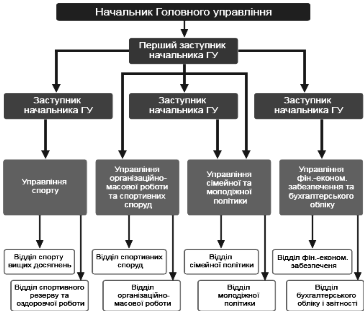
Рис. 2.1. Структура управління державною сімейною політикою

Зазначимо, що у нашій країні відсутня єдина правова база державної сімейної політики. Будь-які заходи, які застосовуються з боку державних інституцій, в основному спрямовані на індивідуум і майже не враховують інтереси сім'ї як соціального інституту. Правовий статус сім'ї, який характеризував би її становище по відношенню до держави та її інститутів, не визначений. Законодавством регулюються в основному сімейні права громадян. Політика по відношенню до сім'ї, яка застосовується у соціальній практиці, є пасивною, її функції системно не включені у діяльність органів державної влади, а отже дає їм підстави стверджувати, що проведення соціальної сімейної політики недоцільно, оскільки вся соціальна політика орієнтована на сім'ю. Сам термін «сімейна політика» в державних документах практично не використовується. Міністерства та відомства під сімейною політикою, як правило, розуміють сукупність загальносоціальних заходів, які впливають на життєдіяльність сім'ї, жінок і дітей. В результаті предмет сімейної політики збільшується настільки, що втрачає власні кордони та специфіку самостійного напрямку діяльності, ототожнюється із