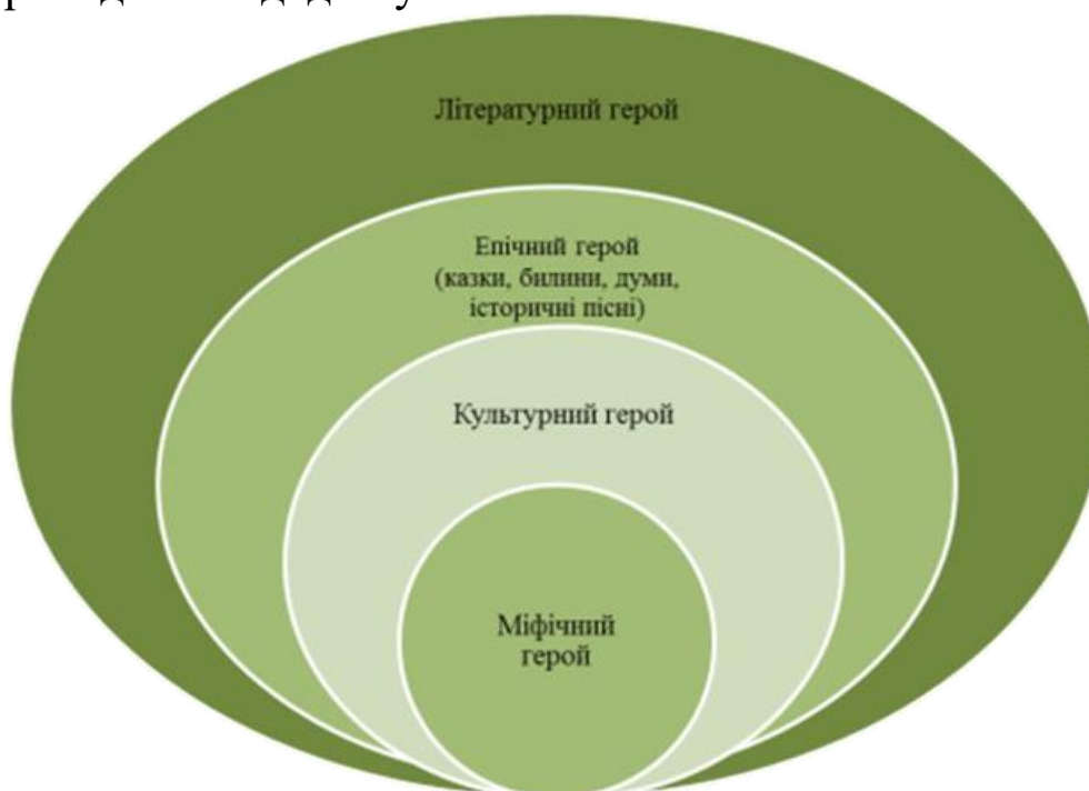
Рис. А. 1. Авторське розроблення етапів формування образу героя в українській літературі

На основі аналізу наукових джерел засвідчено, що й дотепер вчені не мають єдиної думки щодо сутності дефініції «героїчне». Подекуди до героїчних учинків відносять усе, що стосується діяльності людини в соціумі, її поведження в надзвичайних ситуаціях, перед загрозою смерті, під час конфлікту між суспільством і окремим героєм. Усвідомлення «героїчного» в різні історичні періоди здійснювалося за різними критеріями, що яскраво висвітлює процес модифікації суспільних систем, які впливають на розвиток тієї чи іншої культурної парадигми. Саме тому наявні його визначення не можуть бути універсальними. Класифікувати вчинок як героїчний доречно лише за умови наявності конкретної прогресивної мети та її соціально вартісного змісту. З'ясовано, що поняття «герой» – багатозначне (міфічний герой, епічний герой, літературний герой, історичний герой). Варто підкреслити, що літературний герой еволюціонував від міфічного та фольклорного (бог, напівбог, культурний герой, реальний історичний, культурний чи політичний діяч, тобто будь-яка видатна особа) до літературного. Етапи формування образу героя в українській літературі подаємо в додатку А.