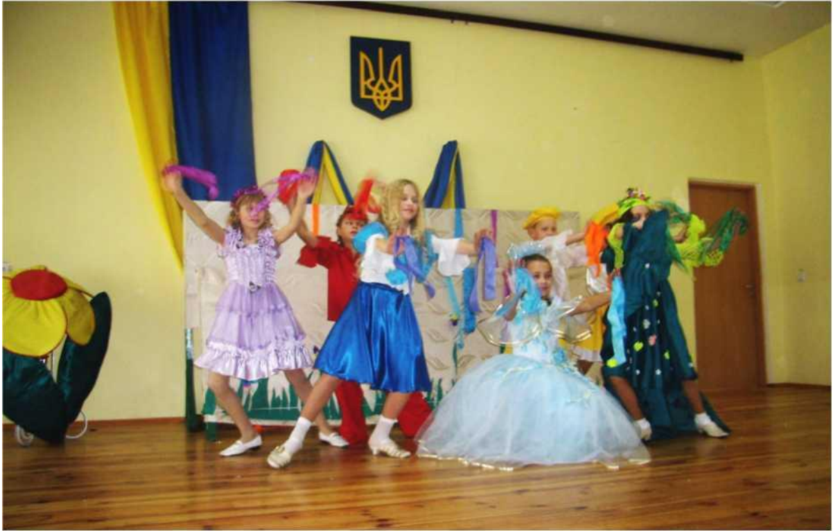
Кольорова галявина. Сцена із вистави «Веселкові барви»