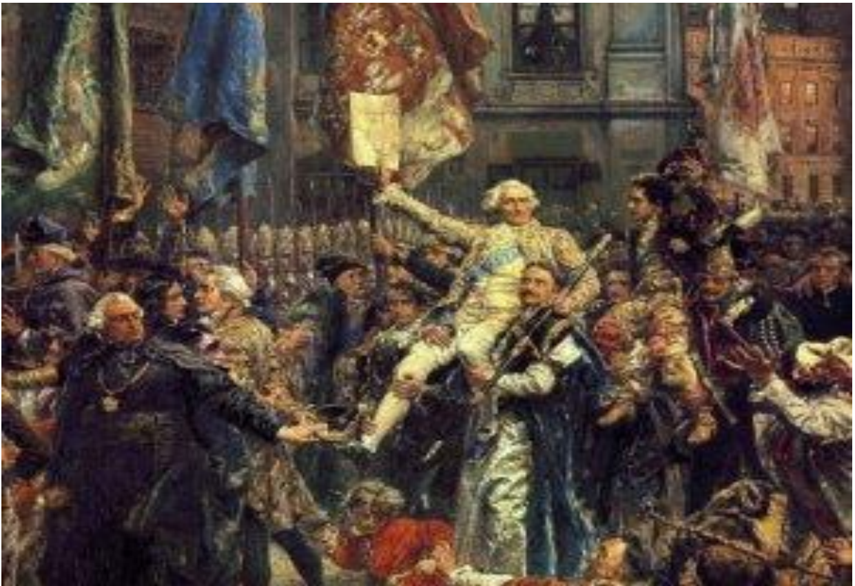
Jan Matejko „Konstytucja 3 Maja 1791 roku”

3 (третього) травня – польське державне свято, яке відзначається в річницю прийняття Конституції 3 (III) травня Речі Посполитої. З 2007 (дві тисячі сьомого року) це свято також є національним у Литві. Гюго Коллонтай та Ігнацій Потоцький розробили проєкт конституції. Її текст був затверджений королем Станіславом Августом. Конституція була проголошена в 1791 році (одна тисяча сімсот дев'яносто першому) і передала владу народів та обмежувала правові та політичні привілеї дворянської знаті.