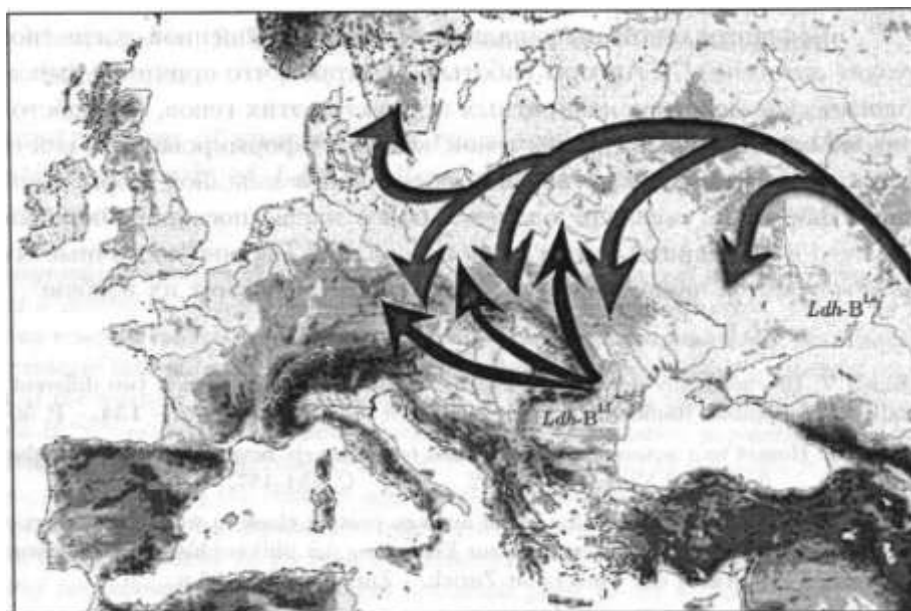
Рис. 2. Характер и направления реколонизационных путей в пределах современного ареала Resculenta (= Iezzona)

также подтверждают результаты данного исследования. Причина этого очевидна — восточноевропейские виды, адаптированные к континентальному климату, засушливому жаркому лету и холодной морозной зиме, мигрируя на запад, легко осваиваются в более мягких условиях, тогда как продвижение западных видов на восточные территории гораздо проблематичнее. И в данном случае особи восточной формы смогли не только распространиться по всему западному ареалу этого вида, но и проникнуть на север Европы, на Скандинавский полуостров (рис. 2), тогда как западные остановились на рубеже Западной и Центральной Украины. Именно в этой части территории Украины располагается изотерма средних годовых минимумом температуры, равная -25\text{ }^{\circ}\text{C} [14], а как раз по линии фазового перехода генных частот проходит изогипса летних осадков на уровне 480 мм (рис. 3). Следует подчеркнуть, что для прудовой лягушки, ведущей полуназемный образ жизни и зимующей на суше, лимитирующими факторами распространения как раз и должны быть низкие зим-