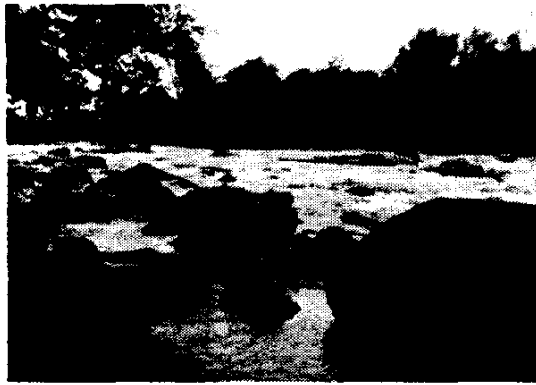
Рис. 1. Південний Буг поблизу с. Сокілець