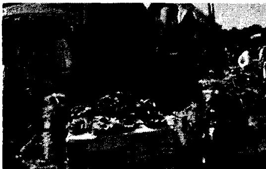
Рис. 5. Фестиваль «Скарби Поділля»

У с. Печера з 2007 р., на березі річки, проводиться фестиваль етно- та рок-музики (рис. 6). Кілька тисяч бажаючих, щороку збираються на початку серпня взяти участь у вражаючому дійстві. Звичайно, це популяризує Південний Буг, як місце для відпочинку, створюючи чудову рекламу, адже у фестивалі беруть участь представники не тільки з району та області, а й усієї України та зарубіжжя.