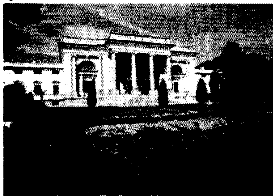
Рис. 7. Палац графині Щербатової

Звичайно, крім природних та антропогенних ресурсів для рекреації є формування відповідної інфраструктури та чинники. У цьому аспекті виявляються, як негативні, так і позитивні тенденції. Характерною особливістю Південного Бугу в Немирівському районі є затоплення незначних площ під час паводків. Поблизу заплави розташовано достатньо сіл, з розвинутою мережею шляхів сполучення і закладами торгівлі що забезпечувати туристів певними послугами і зручностями з метою відпочинку. Взагалі, прилеглі до Південного Бугу населені пункти сприяють створенню потужної системи для розвитку туризму в Немирові та смт. Брацлав мають чимало цікавих для туристів об'єктів, що пояснюється їх минулим. Завдяки багатій історії населених пунктах збереглися унікальні пам'ятки архітектури. В Немирові – палац графині Щербатової (рис. 7), кілька водяних млинів в Брацлаві – маєток Потоцьких, Брацлавська ГЕС (рис. 8). Брацлав є батьківщиною засновника хасидизму Раббі Нахмана