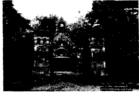
Рис. 4. Дендропарк Болеслава Щенсни-Потоцького (с. Печера)

Як зазначалось, можна виділити окрему групу так званих подієвих ресурсів, пов'язаних із проведенням різних культурних та політичних заходів. У 2007–2009 рр. на заплаві Південного Бугу, поблизу с. Воробіївка, проводився міжнародний етнофестиваль «Шешори». На жаль, місце проведення після трьох років було змінено, проте багато туристів і досі приїжджають на річку, захоплюючись її красою. У тому ж таки селі, з 2012 р. проводиться фестиваль «Скарби Поділля», приурочений до Дня незалежності України (рис. 5).