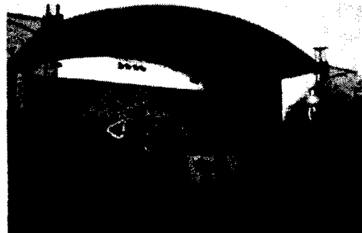
Рис. 6. Рок-фестиваль «Млиноманія»