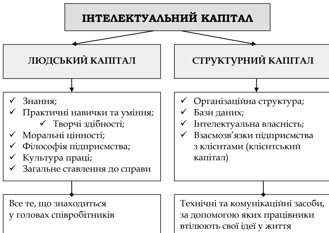
Рис. 1. Структура інтелектуального капіталу підприємства (за Л. Едвінссоном та М. Мелоуном) [5]

Перший підхід є найпоширенішим, його сутність полягає у визначенні інтелектуального капіталу через розкриття його структури. На підставі досліджень, проведених у шведській страховій і фінансовій компанії „Скандія” Л. Едвінссон та М. Мелоун виділили в межах інтелектуального капіталу „людський капітал” і „структурний капітал” (рис. 1).