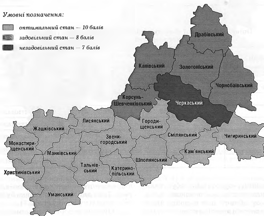
Рис. 3. Придатність сільськогосподарських угідь Черкаської області для отримання зерна пшениці озимої 1 класу якості за кількістю опадів (середні багаторічні дані)