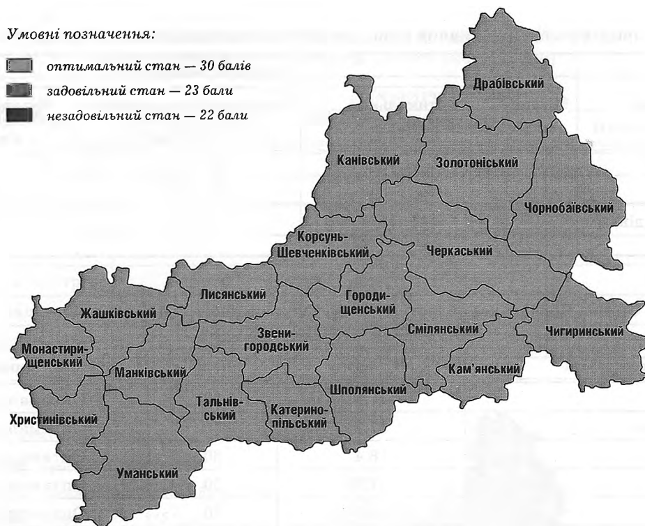
Рис. 2. Придатність сільськогосподарських угідь Черкаської області для отримання зерна пшениці 1 класу якості за температурою повітря (середні багаторічні дані)