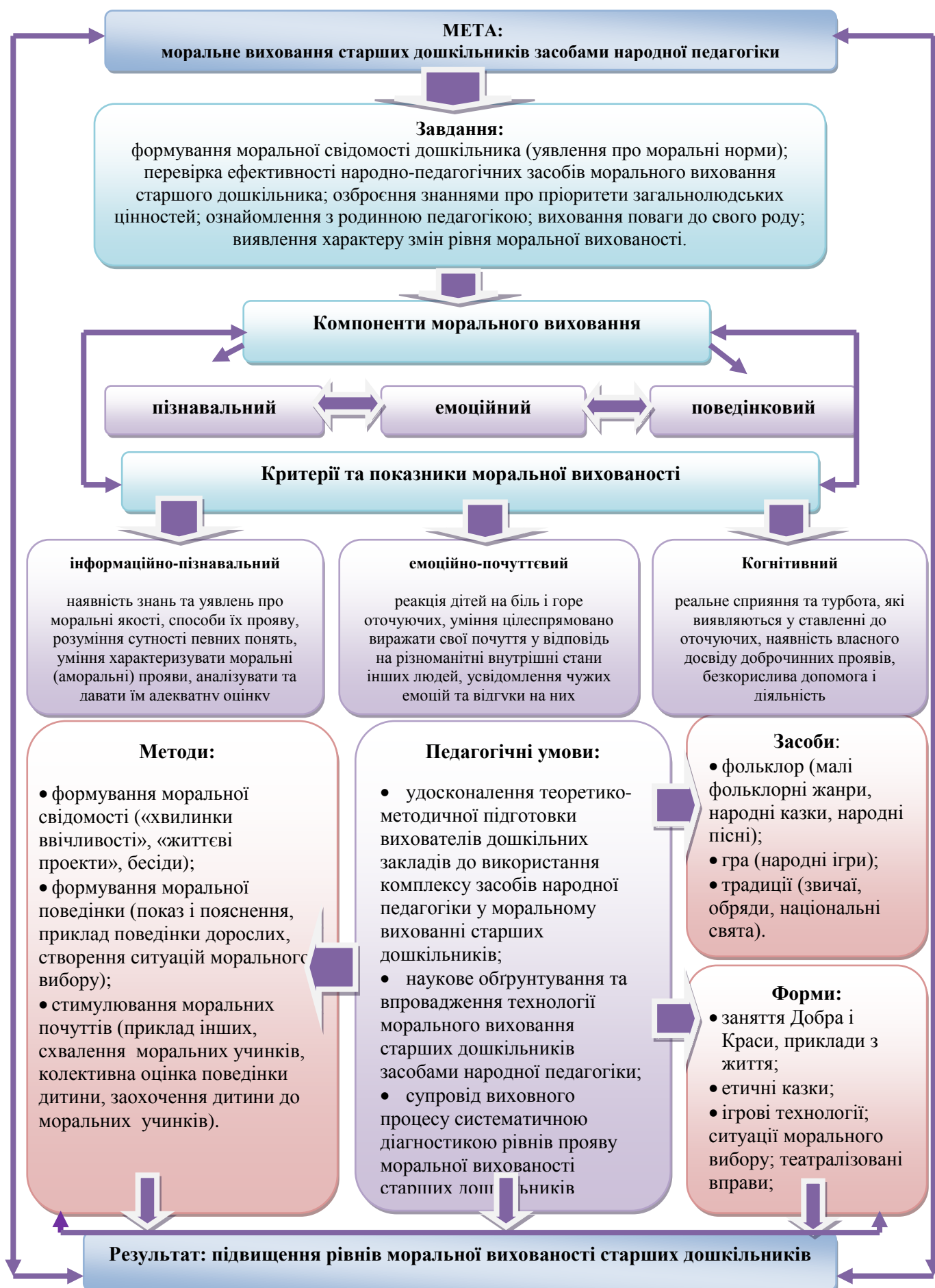
Рис. 1. Технологія морального виховання старших дошкільників