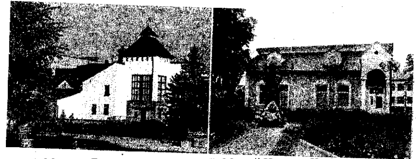
а) Музей «Бойовщина» б) Музей Наталі Кобринської Рис. 3 а, б). Етнографічний музей

1990-х рр., та повністю знищили частину колій. З 2000 рр. лінією вздовж р. Мбунки експлуатують за первісним призначенням. Нею регулярно курсують потяги, і до неї везуть деревину та лісопродукцію. Рухомий парк «Карпатського трамвая» сьогодні складається з двох пасажирських вагонів і відкритої платформи. Поблизу входу із смт. Вигода встановлено пам'ятник Карпатському трамваю - паротяг ВП-4 випуску 1948 р. [3].