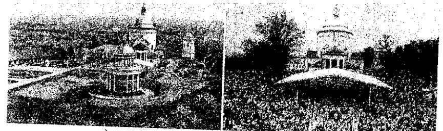
а) б) Рис. 4 (а, б). Гопівський монастир

Перлиною Долинщини є джерело мінеральних вод, аналоги таких загальнонародних як «Нафтуся», «Миргородська» та «Моршинська». На базі цих мінеральних джерел у другій половині ХХ ст. було збудовано санаторій «Джерело Прикарпаття», в якому проходили реабілітацію космонавти. Запаси мінеральних вод дають змогу використовувати їх лікувальною метою та для широкого споживання [6].