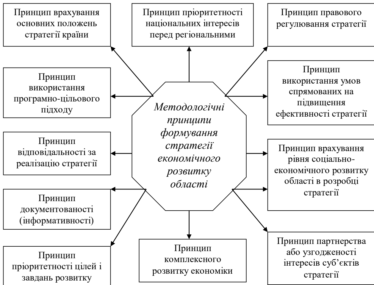
Рис.1 Основні принципи побудови стратегії економічного розвитку області.

Принципи формування стратегії представляють собою набір положень за якими потрібно будувати стратегію, впроваджувати її у життя, здійснювати її коригування. Частина принципів може бути постійною, тобто не змінюватись впродовж реалізації стратегії або деякого проміжку часу, інші можуть мати кон'юнктурний характер, тобто коригуватись залежно від ситуації. За основу ми пропонуємо взяти наступні принципи (рис.1) [4].