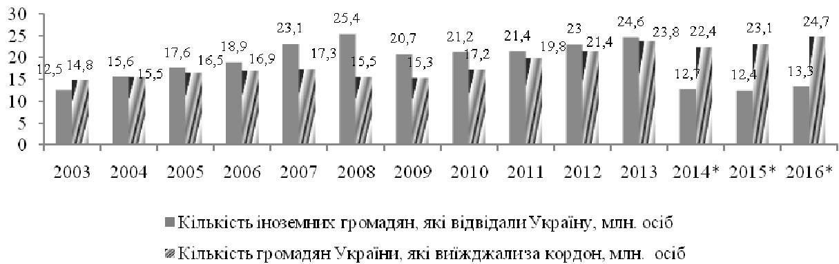
Рис. 1. - Динаміка туристичних потоків в Україні у 2003-2016 рр.*

* Без урахування тимчасово окупованої території Автономної Республіки Крим, м.Севастополя та частини зони проведення антитерористичної операції